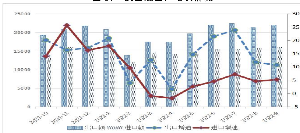
图 1： 我国进出口增长情况

今年以来，疫情形势一波三折，国际环境逐步转差，海外市场需求稳定性减弱，但我国积极实施稳增长政策，加大稳外贸措施力度，外贸发展内生动力强劲。前三季度，我国进出口总值 31.11 万亿元人民币，比去年同期增长 9.9%；出口 17.67 万亿元，增长 13.8%；进口 13.44 万亿元，增长 5.2%。对外贸易在上年高增长的基础上，继续实现平稳较快增长，成绩取得来之不易。前三季度，我国净出口对国民经济贡献率达到 32%，拉动 GDP 增长 1 个百分点，为稳定宏观经济大盘作出积极贡献。